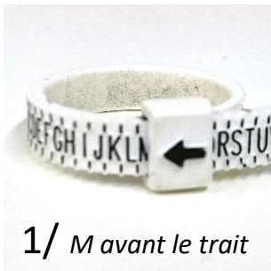
1/ M avant le trait

Indiquez moi bien si c'est avant le trait (photo 1), sur le trait (photo 2) ou après le trait (photo 3)