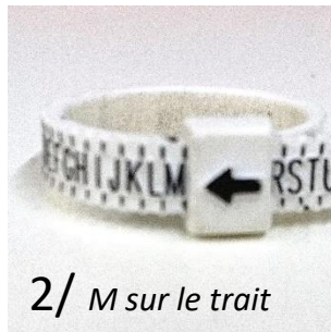
2/ M sur le trait